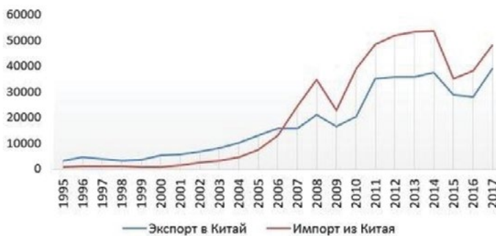
Торговля РФ с Китаем, миллионов долларов США