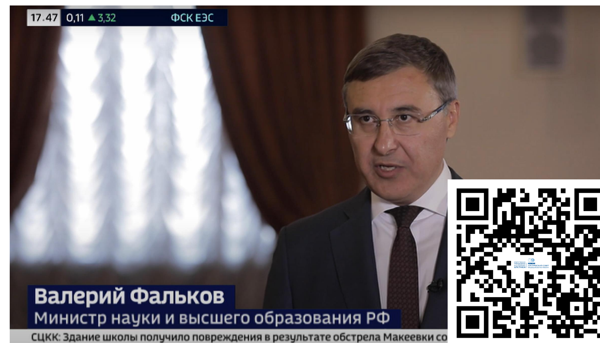
Валерий Фальков Министр науки и высшего образования РФ

«В программу “Приоритет-2030. Дальний Восток” отобрали 12 ВУЗов, часть их них готовят кадры , в том числе и для арктических регионов »